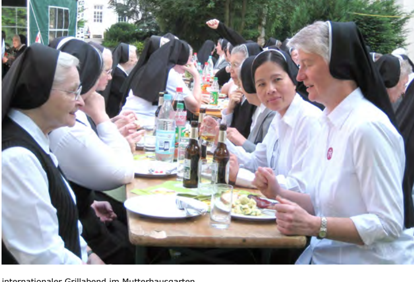
Internationaler Grillabend im Mutterhausgarten

Es soll zu einer guten Tradition werden, dass die Schützen der Kämpfer Kompanie am Schützenfest-Sonntag den Schwestern im Mutterhaus ein Ständchen bringen.